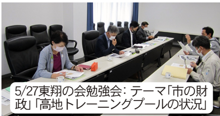
5/27東翔の会勉強会: テーマ「市の財政」「高地トレーニングプールの状況」