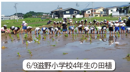
6/9滋野小学校4年生の田植