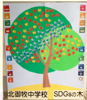
北御牧中学校 SDGsの木