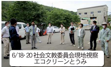
6/18・20 社会文教委員会現地視察 エコクリーンとうみ