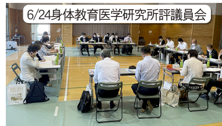
6/24身体教育医学研究所評議員会