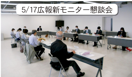
5/17広報新モニター懇談会