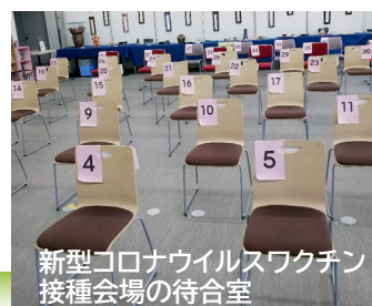
新型コロナウイルスワクチン接種会場の待合室