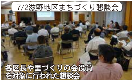
各区長や里づくりの会役員を対象に行われた懇談会