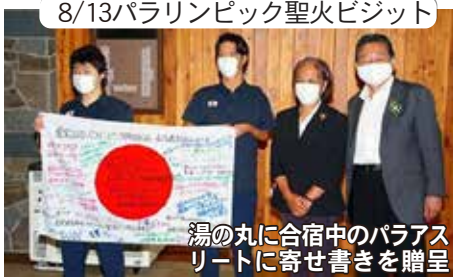
湯の丸に合宿中のパラアスリートに寄せ書きを贈呈