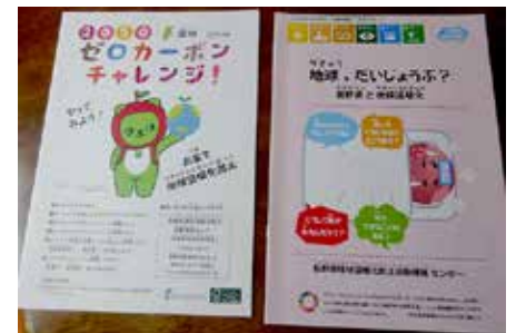
市内小中学生が参加した 環境学習講座のテキスト

【市民生活部長】 住宅用のソーラーパネルや蓄電池などを活用した再生可能エネルギーの導入を促進したり、東御の日にエコライフDAYを実施し、市民の皆さんや事業所の皆さんに生活の中で省エネにつながる行動を呼びかけたり、地域脱炭素社会達成目標年である2050年に主役となる小中学生に向け、県の信州環境カレッジが開講する学校講座を利用した環境学習会の実施等を推進するなど、41の基本施策に取り組んでいる。