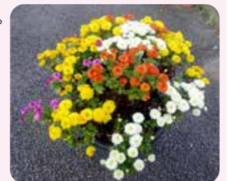
我が家の菊 今年も咲きました！

新型コロナウイルス感染症拡大に伴い1年開催先延ばしとなった2020東京オリンピック・パラリンピックが終わりました。テレビやネットでの観戦を通し日本のアスリートの活躍がまだ鮮明に記憶に刻まれています。2021年もわずか3か月弱となってしまいました。地域活動がなかなか進まない状況下にあります。コロナ感染症対策をはじめインフルエンザ対策・台風シーズンでの災害対策等お互いに気をつけて過ごしましょう。