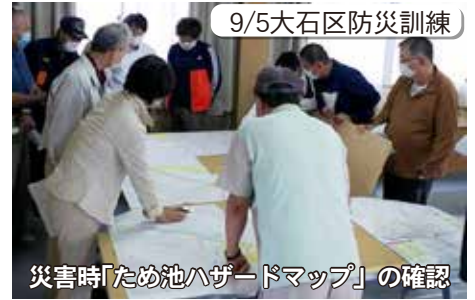
災害時「ため池ハザードマップ」の確認