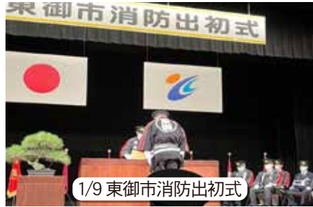
1/9 東御市消防出初式