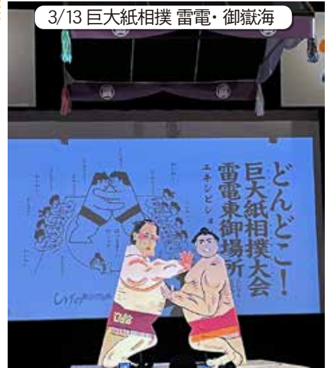
3/13 巨大紙相撲 雷電・御嶽海