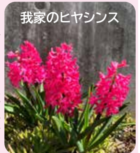
我家のヒヤシンス