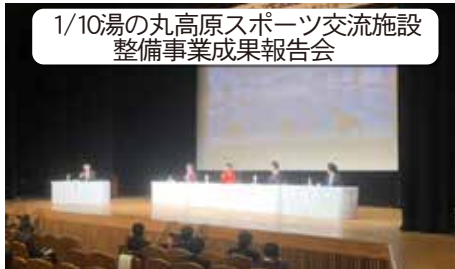
1/10湯の丸高原スポーツ交流施設整備事業成果報告会